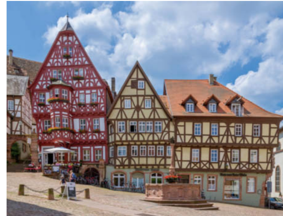
Der historische Marktplatz von Miltenberg.

Unterfranken ist reich an Sehenswürdigkeiten und wunderschönen Landschaften. Bei einer Schifffahrt lassen sich die Natur und die Städte entlang des Mains bewundern, wie die Stadt Miltenberg. Die „Perle des Mains“ blickt auf 3500 Jahre Geschichte zurück und beherbergt in ihrer Burg eine Kunstsammlung aus alten Heiligenbildern und modernen Werken.