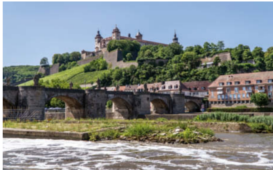
Die Festung Marienberg und die Alte Mainbrücke in Würzburg.

An den Hängen in und um Würzburg wird Wein angebaut, denn das Klima eignet sich bestens dafür. Daher wird die Gegend auch Fränkisches Weinland genannt.