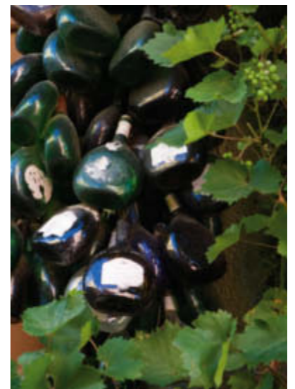
Der Bocksbeutel ist eine flach gedrückte Flasche und das Markenzeichen des Frankenweins.

... es in 97267 Himmelstadt ein Weihnachtspostamt gibt? Dort treffen jährlich über 80 000 Briefe aus fast 120 Ländern ein. Die Kinder schicken ihre Weihnachtswünsche mit der Post und erhalten eine Antwort vom Christkind und seinen Helfern.